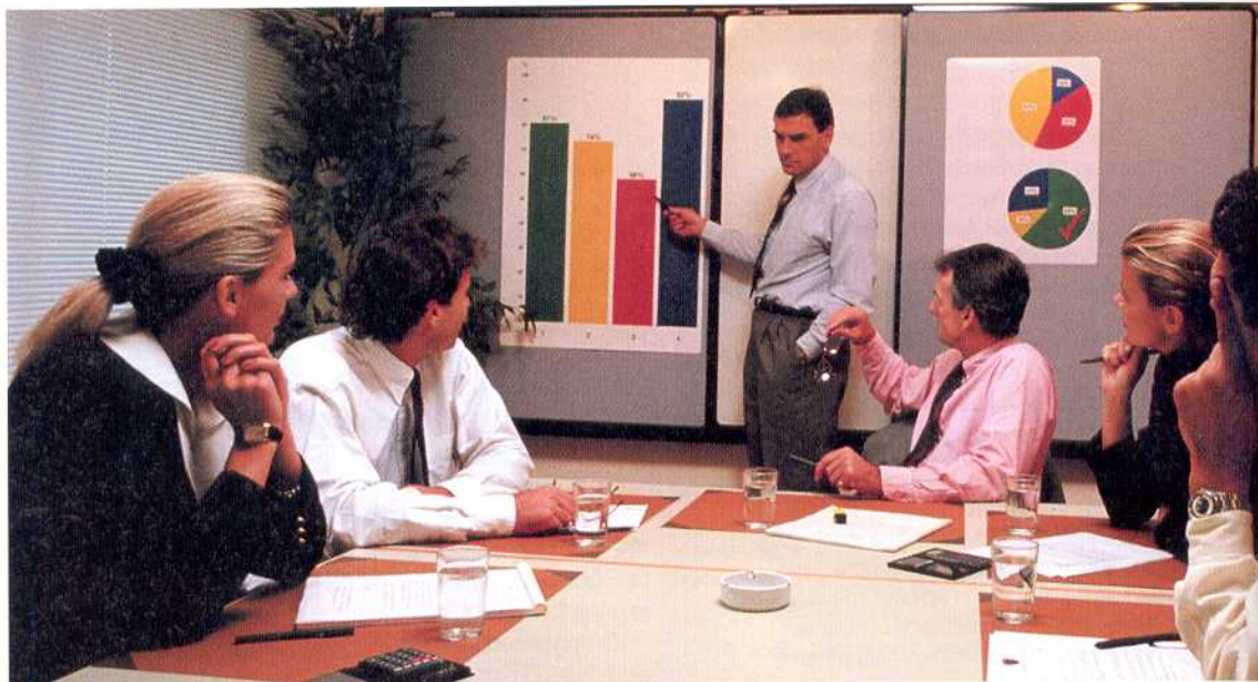
Hilfsmittel: Den Präsentationsinhalt angepasst einsetzen. Wichtige Fakten können stehenbleiben.

ren, Zusammenhänge usw. die Teilnehmer kennen müssen und was davon vorausgesetzt werden kann.